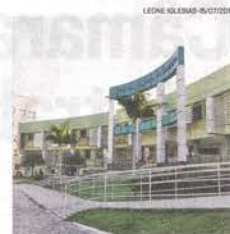
CARIACICA: corte considerado

Em Vitória, a instituição avaliará todas as informações disponíveis para tomar as medidas necessárias até hoje, inclusive em relação ao horário de funcionamento.