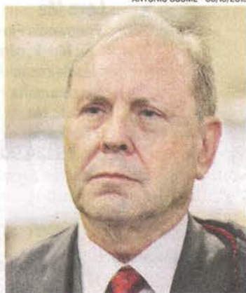
ANNIBAL: chance de conciliação