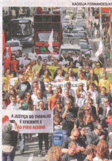
PROTESTO de juízes e advogados

Ele reafirmou que o ato é contra os “absurdos” que têm sido ditos no Congresso e no Supremo Tribunal Federal (STF).