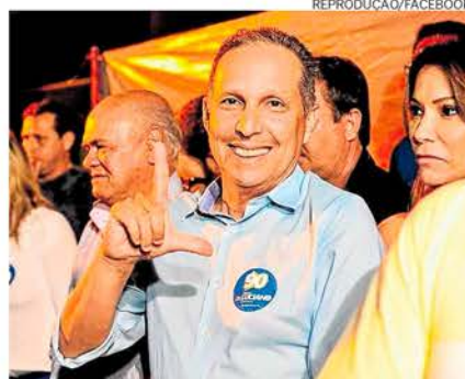
Paiva em campanha em 2016, quando foi reeleito

Diante disso, o Ministério Público Estadual pediu