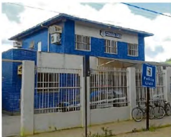
14ª Delegacia Regional, onde caso foi investigado