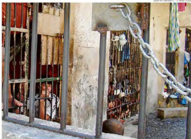
Antigo presídio de Jardim América, em Cariacica, durante a crise de 2009

Os presos têm um perfil específico, determinado pelos órgãos do sistema de Justiça. São pessoas que cumprem a pena em regime semiaberto, trabalham fora do presídio há quatro meses e terminariam as penas em um ano ou menos.