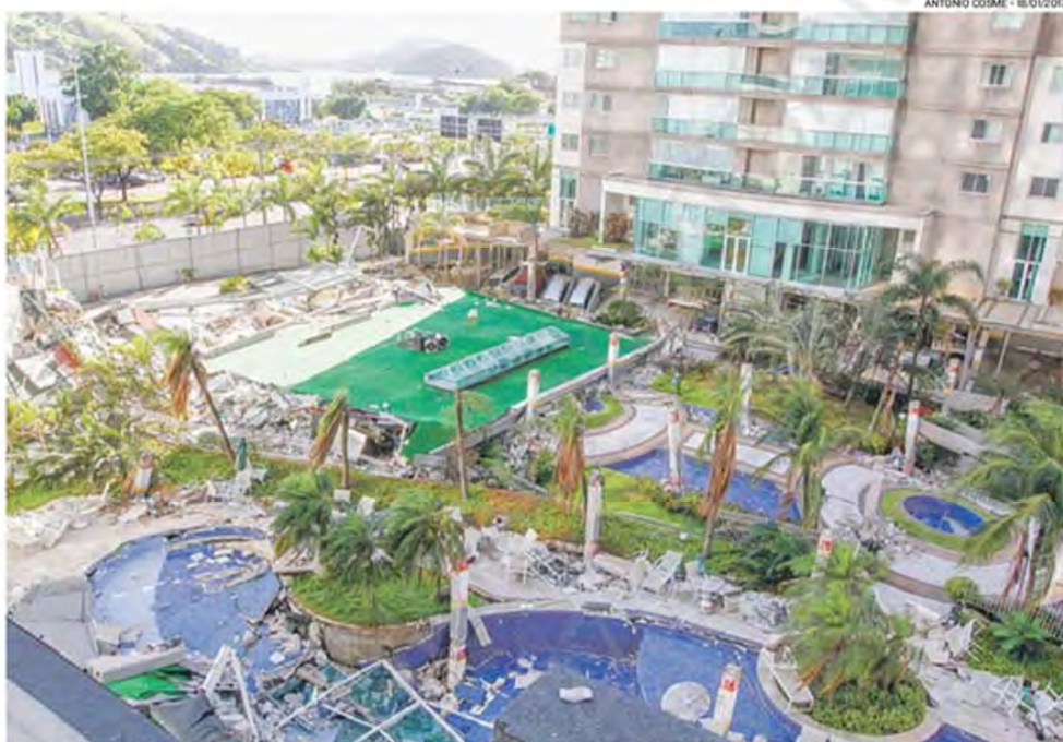
COM O DESABAMENTO da área de lazer do prédio, moradores de 166 apartamentos tiveram de deixar suas casas