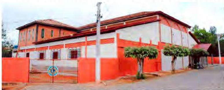
EVENTO será realizado na sede do Lions Clube de Nova Venécia.

A Câmara Municipal de Nova Venécia e o Lions Clube promovem o II Fórum Municipal de Políticas Públicas em Defesa dos Direitos das Mulheres. O evento acontece nos dias 29 e 30 de agosto, a partir das 18h30, no Lions Clube da cidade.