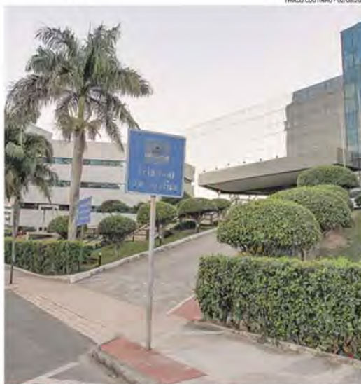
FACHADA do Tribunal: 337 magistrados estão em atividade no Estado

O prefeito foi abordado por um pré-candidato ao cargo de vereador, que lhe chamou, entre outras coisas, de mentiroso.