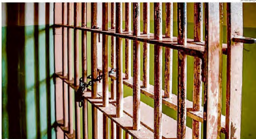
A reincidência no mundo do crime é grande entre os internos que saem dos presídios do Espírito Santo

“Identificamos que a reincidência é muito alta e o esforço da ressocialização não é uma prática brasileira. A maioria dos sistemas prisionais, quase que a totalidade, são voltados para o encarceramento.