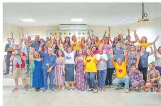
GRUPO de apoio de Guarapari ajuda famílias no processo de adoção

Receber esse amor é algo gratificante demais. Nós damos muito amor para eles, e recebemos tudo isso de volta. Nem todo filho demonstra esse amor, independentemente de ser biológico ou adotivo.