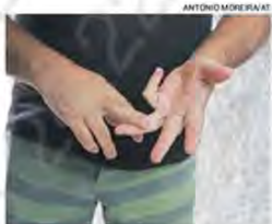
SEGURANÇA imobilizou agressor

O acusado foi levado ao Plantão Especializado da Mulher (PEM), em Vitória. Ele foi autuado em flagrante por tentativa de feminicídio e encaminhado ao Centro de Triagem de Viana (CTV).