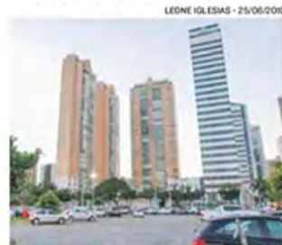
GRAND PARC Residencial: retorno

> OS PROFISSIONAIS vão responder por "causar desabamento ou desmoronamento, expondo a perigo a vida, a integridade física, ou o patrimônio". Também são acusados de homicídio culposo, ou seja, quando não há a intenção de matar.