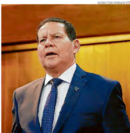
Mourão terá vários compromissos hoje no Estado

Entre a manhã e a tarde de ontem, seguranças e