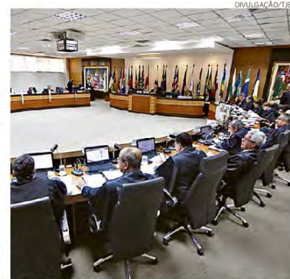
Pleno do TJES: produtividade de magistrados é maior