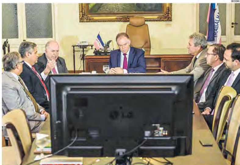
GOVERNADOR Renato Casagrande com autoridades na teleaudiência experimental, no Palácio Anchieta