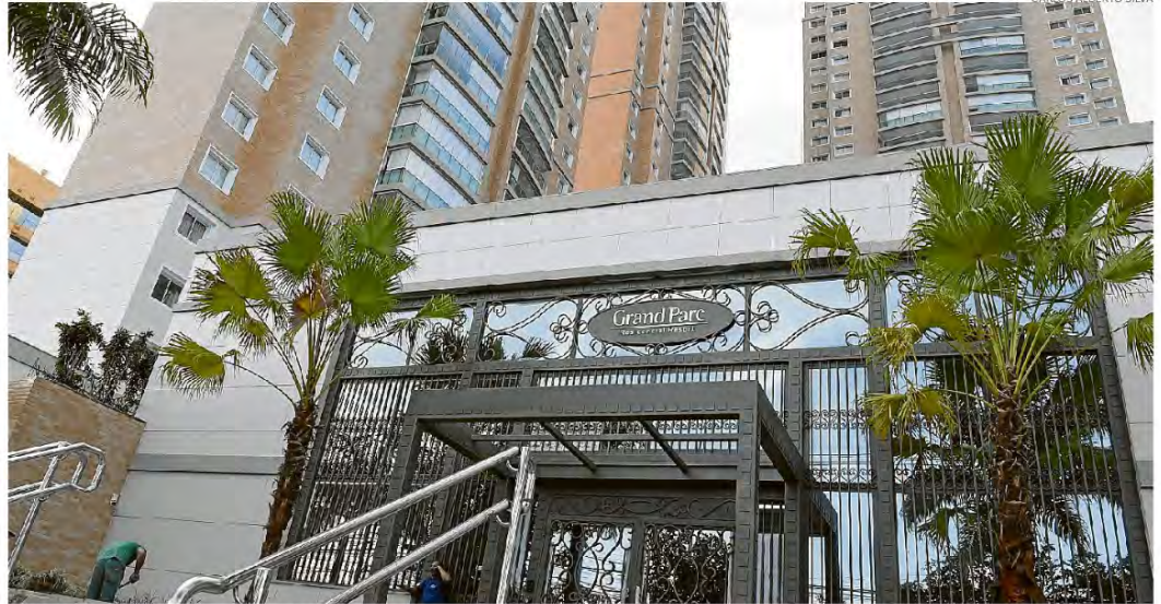
Fachada de como ficou o condomínio Grand Parc, na Capital, após a reconstrução de toda a área de lazer que cedeu há três anos

A denúncia foi aceita pelo juiz Marcelo Menezes Loureiro. "Tendo em vista