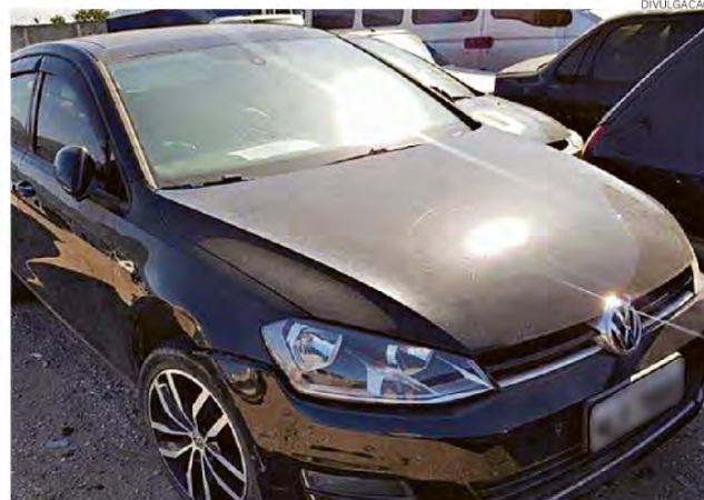
O Kia Soul irá a leilão com lance mínimo de R$ 10 mil. Já o Golf Highline está no lote de veículos da Vara Criminal de Viana, com lance inicial de R$ 12 mil