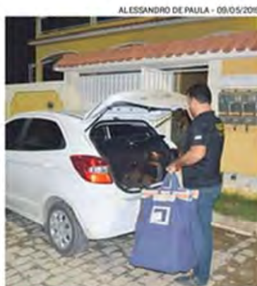
AGENTES apreendem documentos