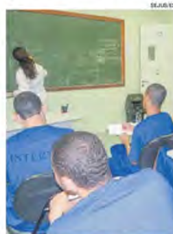
DETENTOS em aula no presídio

A teleaudiência foi realizada pela juíza Gisele Souza de Oliveira, que estava na 4ª Vara Criminal de Vitória, e contou com participação dos réus, que permaneceram no Centro de Detenção Provisória de Viana II (CDPV II), acompanhados