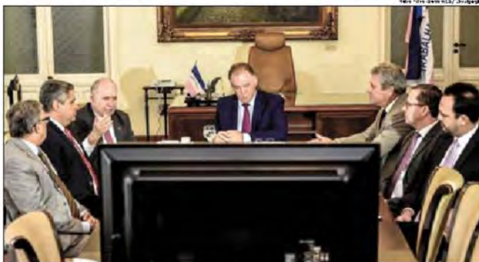
O governador Renato Casagrande ressaltou que a audiência de ontem representa um dia histórico para o Estado do Espírito Santo.

A ação é realizada em parceria com o Instituto de Tecnologia da Informação e Comunicação do Estado do Espírito Santo (Prodest) e interliga o sistema do Tribunal de Justiça do Estado (TJES) com as unidades prisionais. As salas de teleaudiências também serão instaladas em 15 fóruns do Estado. O governador ressaltou que a audiência desta quarta representa um dia his-