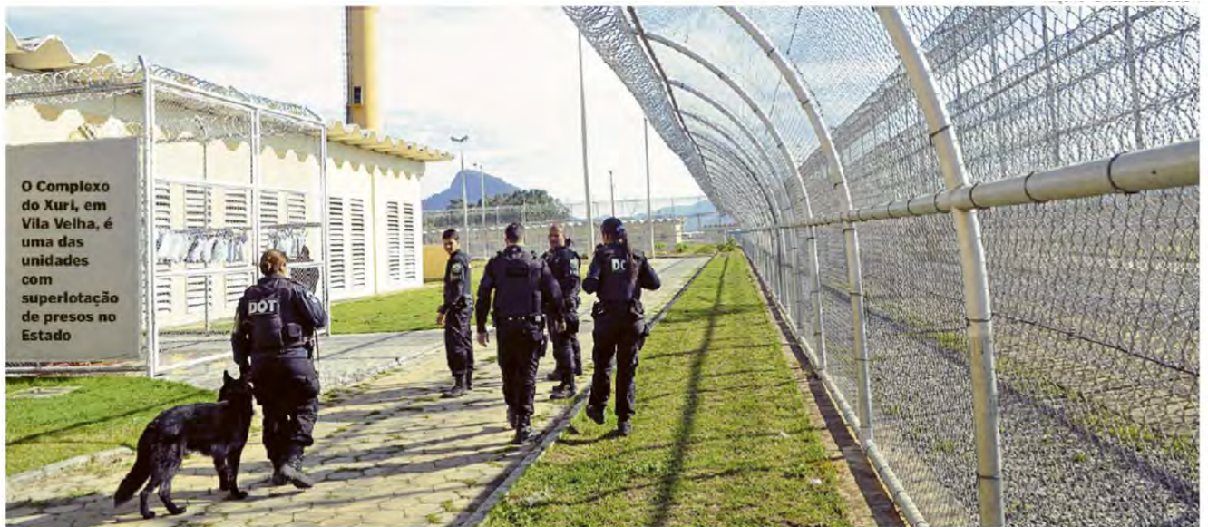
O Complexo do Xuri, em Vila Velha, é uma das unidades com superlotação de presos no Estado