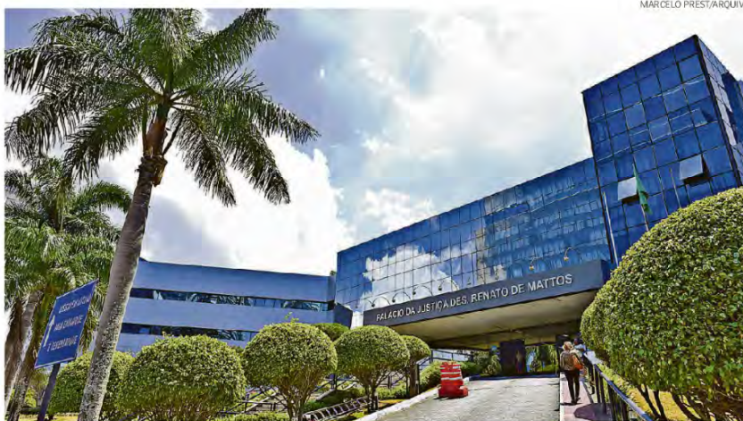
Tribunal de Justiça: desembargador ganha hoje R$ 35,4 mil, mas há outros benefícios e indenizações

Só de salários, em si, um desembargador ganha hoje R$ 35,4 mil e um juiz, R$ 33,6 mil. Eles receberam reajuste de 16,38% nos subsídios em janeiro, após ter havido o aumento dos ministros do Supremo Tribunal Federal (STF), que é o teto do