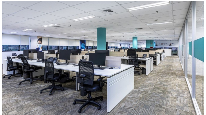
Imagens 01 e 02: exemplos de ambientes corporativos, com áreas de tarefa integradas. Ref.: Escrimóveis , 2022.

Considerando a necessidade de criação de ambientes corporativos judiciários que favoreçam a integração dos servidores e a agilidade na troca de informações, no estilo co-working (ver imagens 01, 02 ,03 e 04),